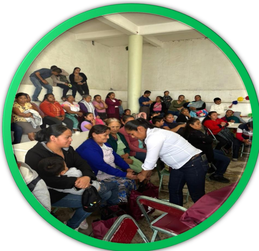
La Presidenta Municipal en un encuentro con mujeres de Coatepec.