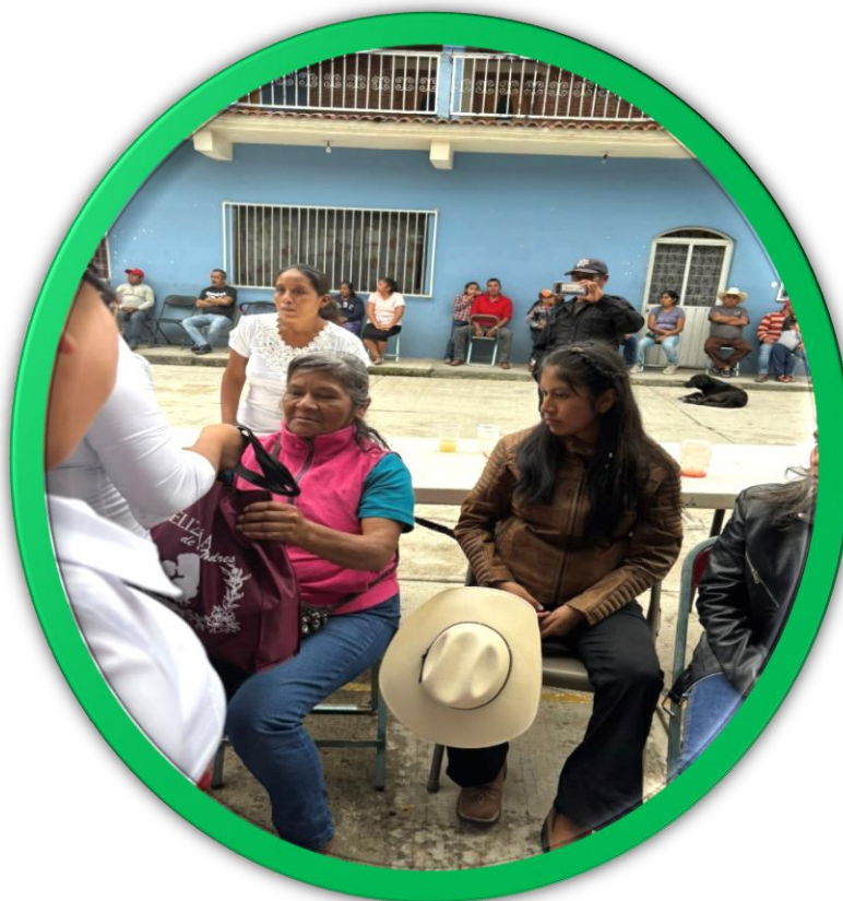
La Presidenta Municipal entregando regalos en el Día Internacional de la Mujer.