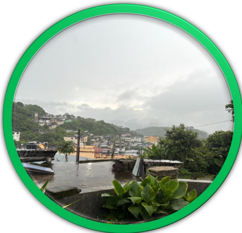
Vista panorámica de la localidad de Coatepec en día lluvioso