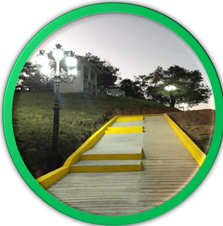
Camino pavimentado a la escuela primaria de la localidad de Coatepec.